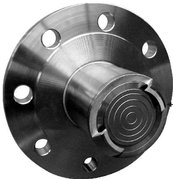
Комплект водного сопла и направляющие-дисперсионного экрана

Разделитель с системой промывания применяется там, где в технологическом процессе возникает зарастание мембраны. Периодическая промывка водой или другим растворителем может происходить в ручном или автоматическом режиме.